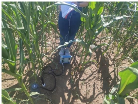
Imagini din timpul campaniilor de teren

Dezbaterea s-a încheiat prin prezentarea perspectivele viitoare ale cercetărilor întreprinse în cadrul proiectului, ținând cont de importanța sectorului LULUCF în raportările asumate ca urmare a semnării de către țara noastră a Acordului de la Paris.