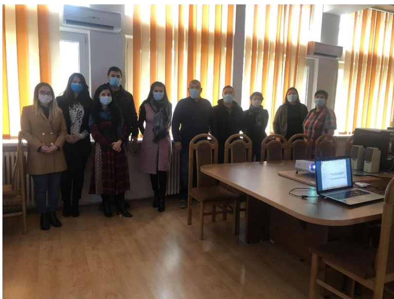
Imagini din timpul dezbaterii naționale

On-line, au fost prezenți și reprezentanți ai Universității „Dunărea de Jos” din Galați și Universității Tehnice de Construcții din Cluj-Napoca.